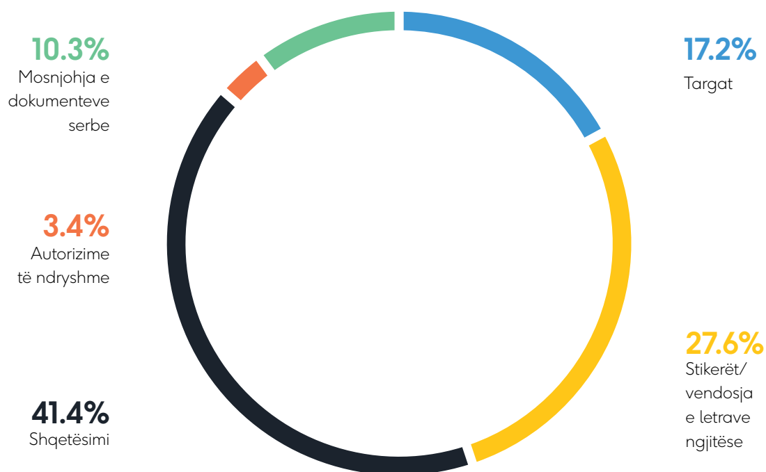
Grafiku 3. Problemet me të cilat ballafaqohen të anketuarit në vendkalime

Pjesëmarrësit e fokus grupeve në katër komunat veriore e kanë ndërlidhur lirinë e lëvizjes me çështjen e sigurisë së përgjithshme në atë pjesë të Kosovës. Konfuzion dhe komplikim shtesë për banorët e katër komunave në veri të Kosovës krijon dokumentacioni, konkretisht letërnjoftimet e lëshuara nga Ministria e Punëve të Brendshme të Serbisë për qytetarët që banojnë në një nga qytetet e territorit të Kosovës. Është e qartë se konfuzioni është krijuar nga interpretimi i ndryshëm i asaj që u ra dakord në Bruksel, dhe siç shihet nga raporti i fokus grupit, reflekton si në lirinë e lëvizjes ashtu edhe në sigurinë e përgjithshme. 28